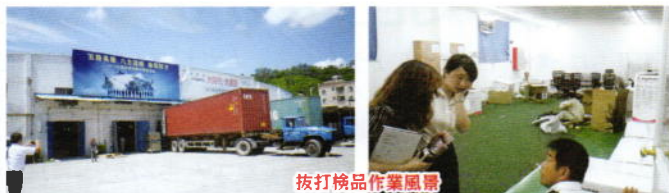
抜打検品作業風景