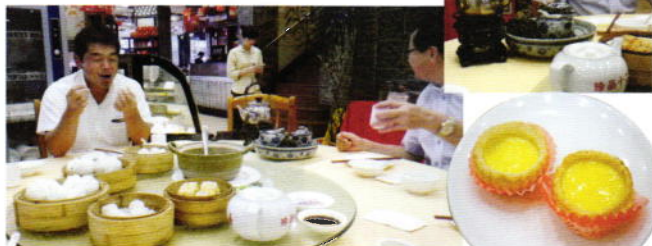
社長お気に入りのお店にて☆