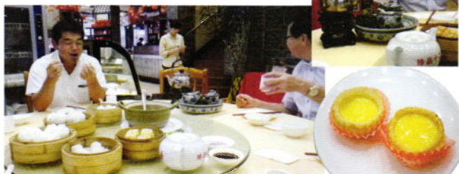
社長お気に入りのお店にて☆