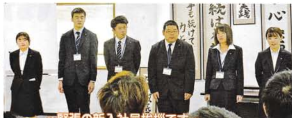
~緊張の新入社員挨拶です~