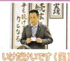
いげだけいです(笑)

今年も新入社員を迎えることができました。4月1日(月)男性3名、女性3名、計6名です。みなさんよろしくお願いします!!