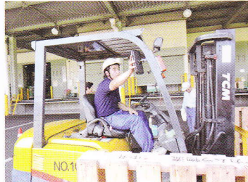
指差呼称！安全確認！