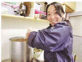
いつも美味しいカレーです♡