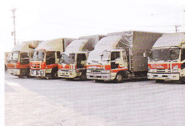
大雪の日もありました・・・