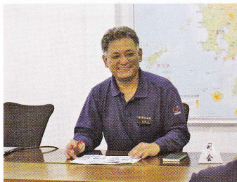
古賀先生による新入社員研修！