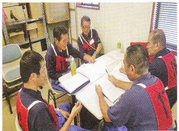
しっかり話し合い☆