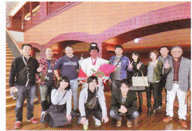
～応援に駆けつけました～

メールマガジン、復活しました！！社長のブログとフェイスブック更新中！よろしければHPより、是非ご覧ください。