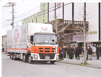
～初荷式に参加しました～