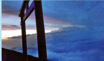
一日目は、7号目の鳥居そばの山小屋に宿泊。

売上計画達成祈願登山で富士山に登ってきました。 ある社長のまねをして約 10 年前から行ってます。 売上計画 20 億の年は 2000メートルの山（岩手山）、 24 億のときは 2400メートル（妙高山）、30 億の ときは 3000メートル（立山）に行ってきました。 今期の目標は 38 億です。そこで富士山を選びました。