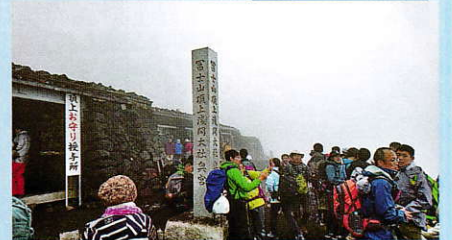
頂上、あいにくの曇りで何も見えません…