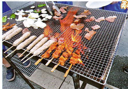
美味しくいただきました!

8/10(木)本社にてバーベキューを行いました。お盆前の区切りとして毎年行っています。社内にはお肉がたくさん...あまり見る事のない光景に思わず写真を!たいへん美味しくいただきました!暑い中みなさんお疲れ様でした。後半も頑張っていきましょう!