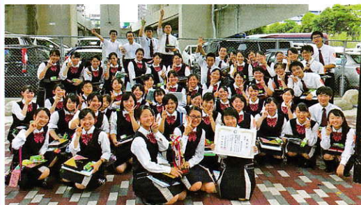
勝利の女神?勝利の七か?高回ドライバーと共!