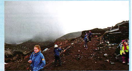
火口です。富士山は火山なんだと実感できます。

今回一人での行動でしたので、この1か月間、エスカレーターを使わずに階段を上り下りしたり、久住に毎週登ったり、必要なものを準備したりでした。何か達成感があります。祈願登山の名目ではなく来年もいきたいと思います。