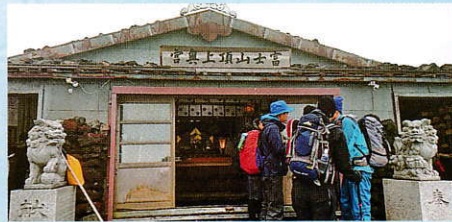
頂上付近の神社です。