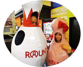
みんな楽し！ほのほのコンビ。