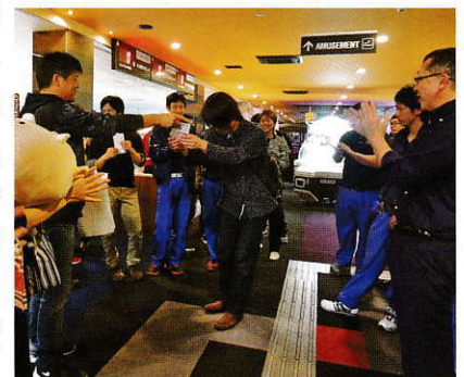
恒例の社長賞もご用意。