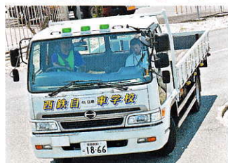
安全の為、点検をしっかり！