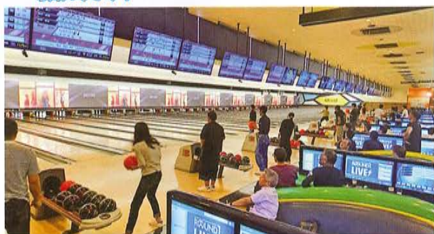
筋力痛は大丈夫でしたか？ 皆で楽しめましたか？