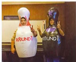
なんか着ています(笑)。