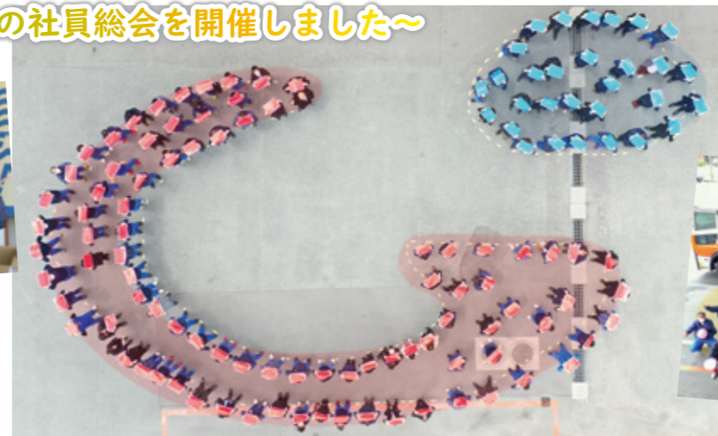
柳川合同の「イメージマーク」と「67」をみんぽでつくりました★