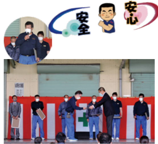
無事故表彰 15年以上の方を掲載しています。