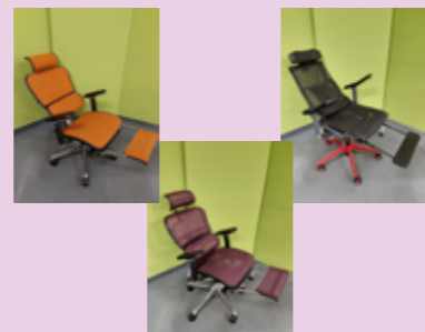
オンラインでもオフでも快適～☆

さて、杉戸営業所の屋上では七色の虹が見えますが、屋内では七色のチェアをアウトレット販売しております(無理矢理でしょうか笑)。メッシュ生地の種類も併せれば十色以上のバリエーションで取り揃えており、近々特設ページをホームページに掲載予定です！腰にやさしく、長時間作業をされる方には特におすすめのチェアです。小休憩もできて疲れにくい、こんなに肥えている私でもゆったり体を預けられるお椅子をお探しの方はぜひご一報いただければ幸いです。それでは今月もご安全に！