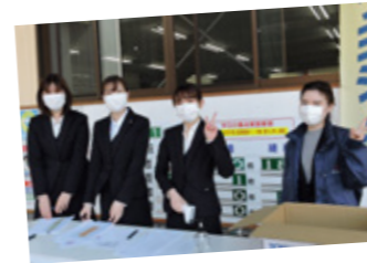
受付時に、全員検温とアルコール消毒を行いました。