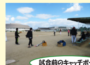
試合前のキャッチボール