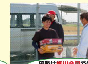
優勝は柳川合同でした