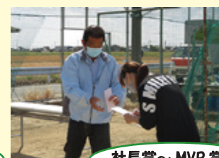
社長賞～ MVP 賞～