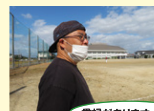
賞状があります（笑）