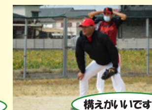
構えがいいですね！