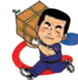
テッコン君 2009年誕生