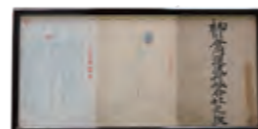
柳川合同運送株式会社 創立当時の定款

4/28、柳川合同は創立68周年を迎えます。今の柳川合同は、先輩方の築いてこられた歴史と、現在私たちが積み重ねている日々によるものです。この節目を迎えられたことに感謝し、決意新たにしていきます。日頃より、弊社をご最良、ご支援いただいている皆様、誠にありがとうございます。今後とも、柳川合同をよろしくお願ひ申し上げます。