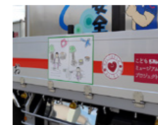
左右でデザインが異なりますので、ぜひご注目ください（*^-^*）