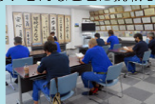
柳川合同について学びました！