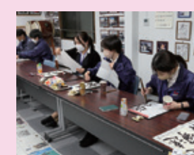
社長塾 ～来年の抱負を書初め～