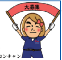
妹：テッコンちゃん