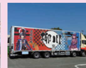
柳川市&大刀洗町 RTトラック納車しました!