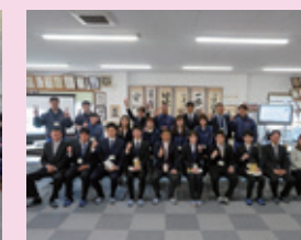
入社式 ～新しい仲間が増えました～