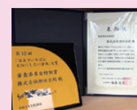
日本で一番大切にしたい会社 ～審査委員会特別賞を受賞!～