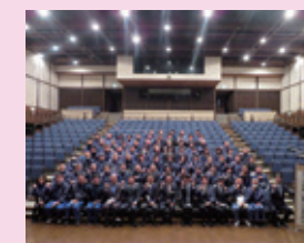
新年式 ～2022年スタート～