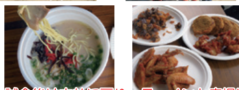
試合後は本社に戻り、ラーメンと唐揚げなどをいただきました！