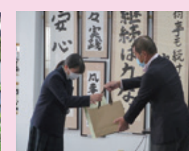
内定式 ～坂の上の雲お渡ししました～