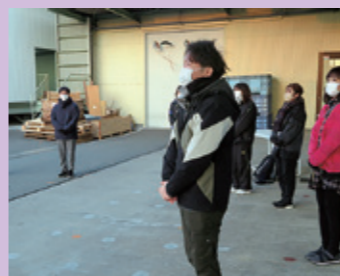
実行委員長の挨拶

1/22（日）に柳川本社にて、30kmウォークイベントを開催しました！ 30kmウォークは今年で3回目の開催です。本社を出発したあと、道の駅みやま・清水寺・オニマルを巡り、本社に戻ってくる6～7時間のコースでした。清水寺までの長～い参道や長～い階段には心が折れそうになりましたが、オニマルで振る舞っていただいたラーメン・高菜ドック・高菜チャーハンおにぎりを食べて元気が出ました！午後からは生憎の雨で寒さもありましたが、多くの方がゴールできました。ゴールできた皆さんおめでとうございます（^）途中でリタイアされた方もお疲れ様でした。