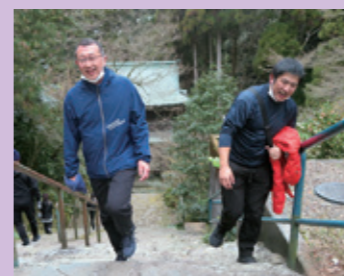
清水寺の階段きつそうですね…