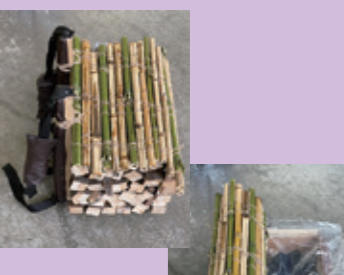
薪の中は防雨対策もばっちり☆