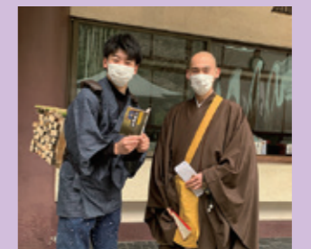
二宮金次郎先生も参加されました！