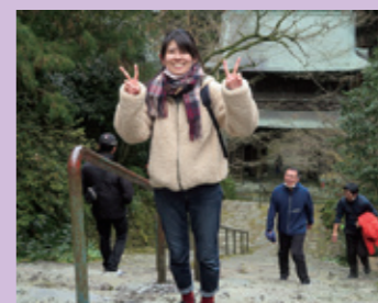
階段を登った後にこの笑顔☆