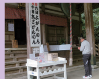
社長が参拝されてます