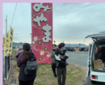
道の駅みやままでちょっと休憩