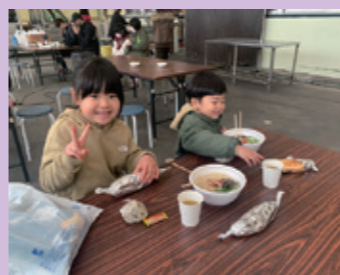
可愛い二人も参加してくれました ゴール！雨にも濡れてお疲れの様子…