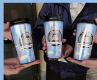
創立69周年を迎えました