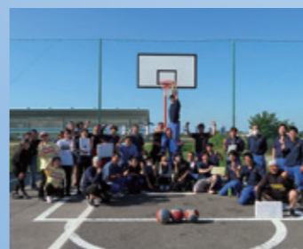
バスケットボール大会