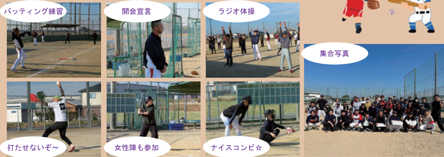
バッティング練習 開会宣言 ラジオ体操 打たせないぞ～ 女性陣も参加 ナイスコンビ☆ 集合写真