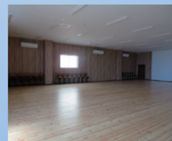
本社をリニューアル