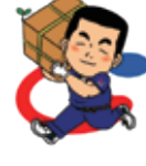
テッコン君 2009年誕生