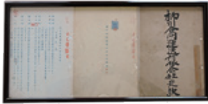
柳川合同運送有限公司 創立当時の定款

今の柳川合同は、先輩方の築いてこられた歴史と、現在私たちが積み重ねている日々によるものです。この節目を迎えられたことに感謝し、決意を新たにしていきます。日頃より弊社をご最厚・ご支援いただいている皆様、誠にありがとうございます。今後とも柳川合同をよろしくお願い申し上げます。