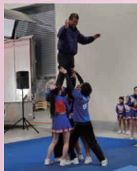
たくさんのご来場 ありがとうございます ございました！！

今回このような形でマルシェを開催することができ、地域の皆様に喜んでいただけて、嬉しく思います。今後も続けていければと思っていますので、皆様今度も柳川合同をよろしくお願いいたします！